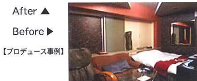
After ▲ Before ▶ 【プロデュース事例】